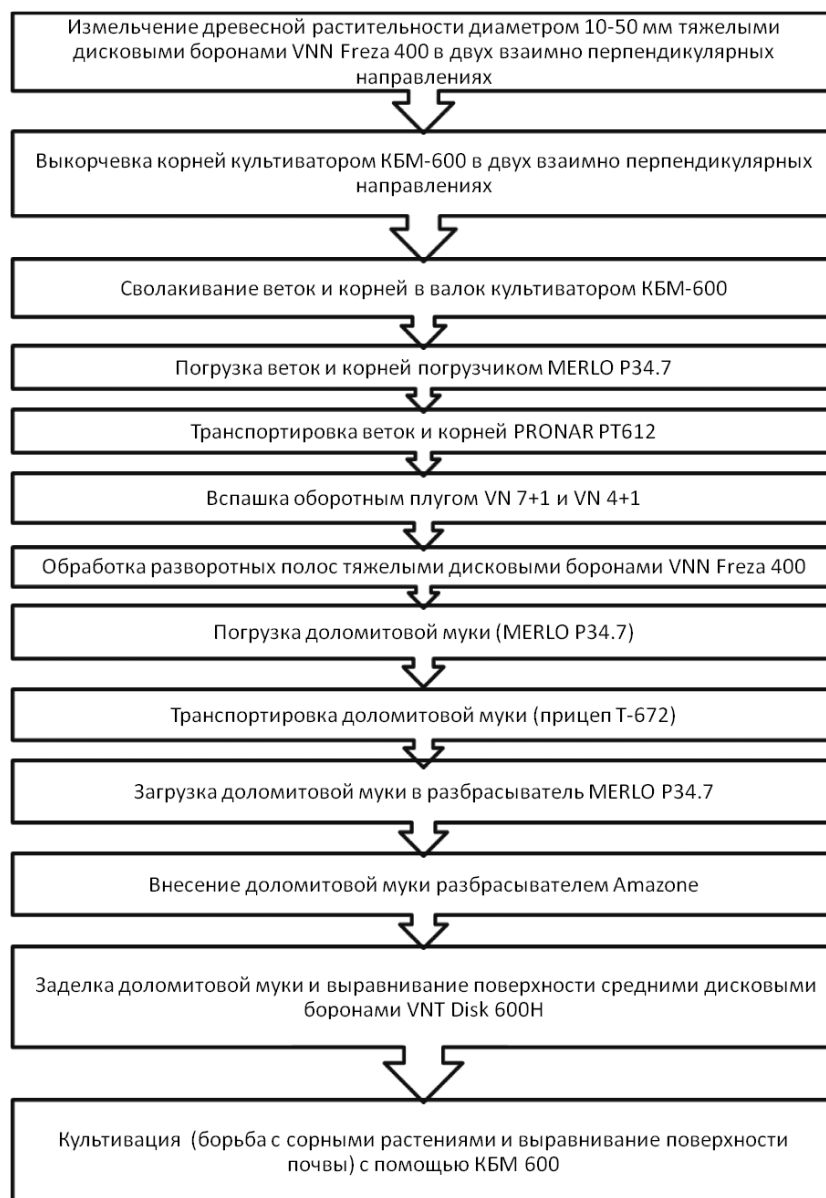
Рисунок 3 – Рекомендации по проведению культуртехнических работ

Таким образом, для введения в хозяйственный оборот неиспользуемых земель сельскохозяйственного назначения в первую очередь