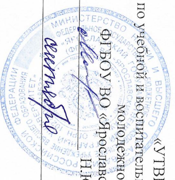
ГРАФИК проведения учебных практик обучающихся по программам бакалавриата 2 курса факультета агробизнеса в 2023-2024 учебном году (очно-заочная форма обучения)